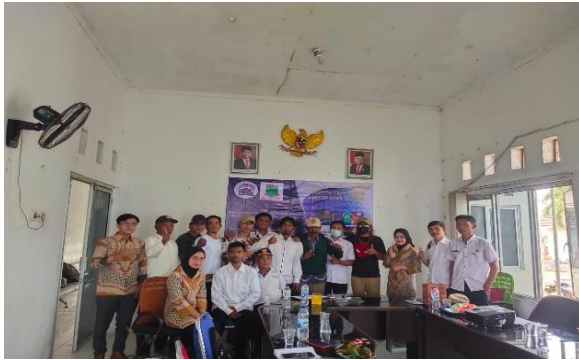
Gambar 9. Foto Bersama Tim Pelaksana dan Peserta