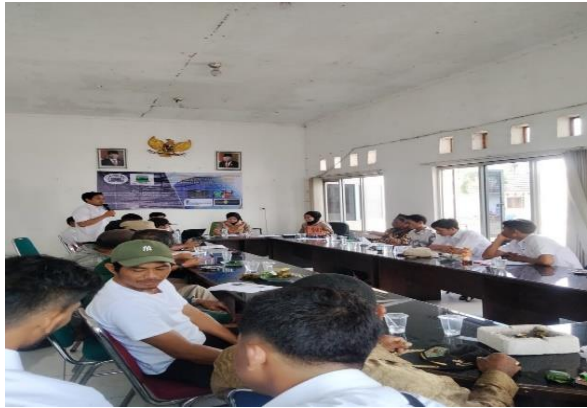
Gambar 3. Sambutan dan Pembukaan oleh Sekdes Desa Tambaksari

Tahapan awal pelaksanaan adalah pengenalan antara pelaksana kegiatan dan peserta kegiatan serta jajarannya struktur desa tambaksari. Kegiatan pelaksanaan disambut dan dibuka langsung oleh sekretaris desa tambaksari dan ketua pelaksana kegiatan dimana menggantikan kepala desa tambaksari yang tidak bisa hadir karena suatu urusan.