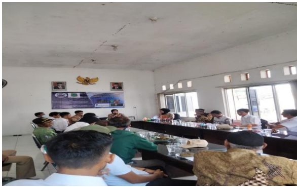
Gambar 5. Materi Ruang dan Jenis Pasar Modal

Materi pada sesi kedua pada Gambar 5 terkait ruang lingkup dan jenis-jenis surat berharga yang diperdagangkan di pasar modal. Dalam sesi ini peserta kegiatan diberikan pemahaman terkait ruang lingkup serta jenis-jenis transaksi di pasar modal seperti karakteristik saham, karakteristik obligasi, karakteristik reksadana, serta instrument lainnya [17], dengan demikian para peserta mampu memahami seluk beluk serta peran penting pasar modal dari yang sebelumnya tidak tau menjadi paham bagaimana pasar modal berperan dalam ekonomi dan pertumbuhan ekonomi nasional, serta mampu memilih instrument investasi yang ada dipasar modal sesuai dengan tujuan yang direncanakan apakah investasi jangka pendek atau jangka panjang.