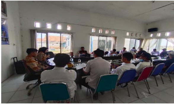
Gambar 2. Sambutan oleh Ketua Pelaksana Kegiatan