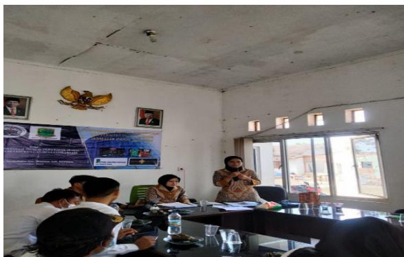
Gambar 4. Materi Pengantar Pasar Modal

Tahapan ini juga adalah bincang santai antara pelaksana kegiatan dan peserta agar terbentuk kedekatan secara sosial dan kekeluargaan. Kemudian dilanjutkan dengan materi sesi pertama terkait pengantar pasar modal seperti pada Gambar 4.: