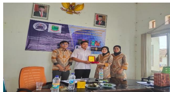
Gambar 8. Penyerahan Cendera Mata kepada Mitra.

Pada sesi terakhir atau penutup ketua tim pelaksana melakukan pemberian cendera mata pada pihak Desa Tambaksari serta ditutup dengan foto bersama seperti pada Gambar 8 dan 9.