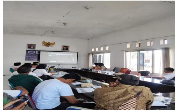
Gambar 7. Materi Pembukaan RDN dan Simulasi Transaksi

Pada sesi ke empat materi yang disampaikan terkait cara pembuatan akun RDN untuk memulai berinvestasi di pasar modal, serta melakukan simulasi dan praktek jual beli langsung di salah satu pasar modal yaitu bursa efek Indonesia, seperti pada Gambar 7.