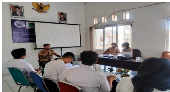
Gambar 6. Materi Money Management dalam Berinvestasi

Pada sesi ketiga materi yang disampaikan terkait pengelolaan dana investasi atau money management, pemahaman materi ini sangat penting pada realisasi dalam berinvestasi, seperti pada Gambar 6.