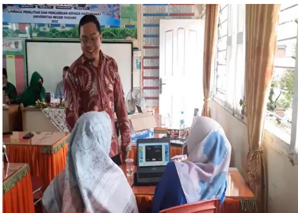
Gambar 2. Pemateri Mendampingi Guru

Selama proses yang terlihat pada gambar 2, setiap guru mendapat pendampingan individu secara berkala, baik melalui pertemuan tatap muka langsung maupun melalui bimbingan online, untuk memastikan implementasi yang efektif. Mereka juga diberi pelatihan tentang cara menjalankan pembelajaran matematika dengan memanfaatkan teknologi secara optimal. Hasil dari desain pembelajaran yang mereka kembangkan selama pelatihan ini direkam sebagai bukti hasil dari kegiatan pelatihan.