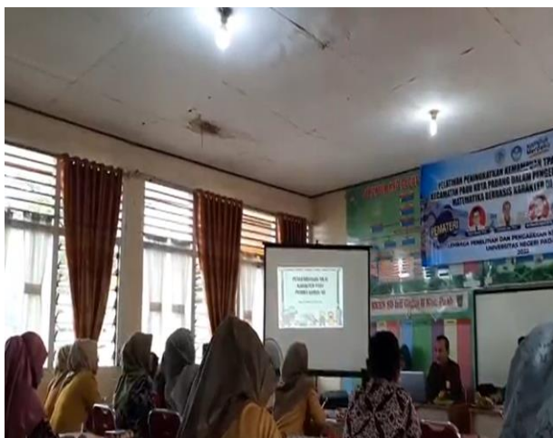
Gambar 1. Suasana Penyampaian Materi P3

Proses kegiatan dimulai dengan mengadakan lokakarya bagi guru SD untuk memperkenalkan konsep P3. Guru-guru dilatih secara intensif tentang penerapan konsep P3 dalam pembelajaran matematika di tingkat SD. Mereka diajarkan cara menginternalisasikan nilai-nilai P3 ke dalam materi-materi pelajaran matematika yang mereka ajarkan seperti yang terlihat pada Gambar 1.